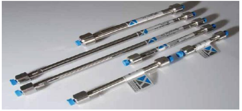
德国 VDS optilab (威尼斯) 色谱技术有限公司液相色谱柱产品树